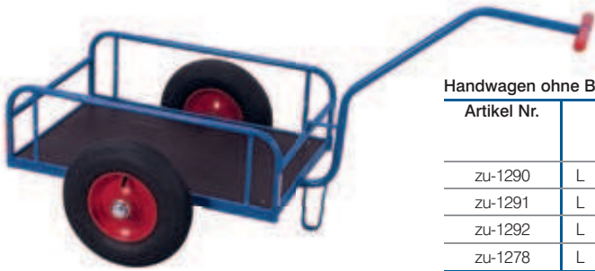
Handwagen ohne Bordwand

Stabile Schweißkonstruktion aus Stahl; Geländer 220 mm hoch; mit Sicherheitsreflektoren; verschraubte Handdeichsel mit PVC-Handgriffen und Standfuß; Ladefläche und optionale Bordwände aus wasserfest verleimtem Sperrholz, Oberfläche Siebdruck, rutschhemmend; Handwagen pulverbeschichtet RAL 5010 enzianblau; dauerhaft oberflächengeschützt; schlag- und kratzfest; Luft- oder Vollgummibereifung auf Stahlfelge mit Präzisions-Rillenkugellager.