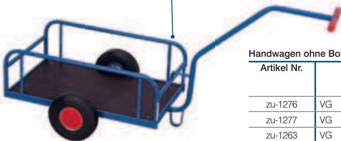
Handwagen ohne Bordwand