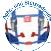
Achse- und Stützradpedal

Je 1 Stück abrutschsicheres Pedal an Achse und Stützrad