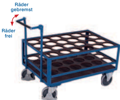
Stahlflaschenwagen mit Totmannbremse

Schweißkonstruktion aus Stahl; Schiebebügel senkrecht oder waagrecht mit Totmannbremse; 2 Ebenen mit Lochausschnitten Ø 160 mm; Ladeflächen aus wasserfest verleimtem Sperrholz Oberfläche Siebdruck, rutschhemmend; für 24 Stück Flaschen; Traglast je Boden 80 kg; Stahlflaschenwagen pulverbeschichtet RAL 5010 enzianblau; dauerhaft oberflächengeschützt; schlag- und kratzfest; Bereifung aus thermoplastischem Gummi auf Kunststoffgele mit Präzisions-Rillenkugellager, grau, "spurlos"; Faden- und Fußschutz; 2 Lenkrollen mit EasySTOP und 2 Bockrollen, oder 2 Lenkrollen mit Totmannbremse und 2 Bockrollen.